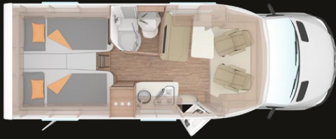
2-3 Personen Grundriss