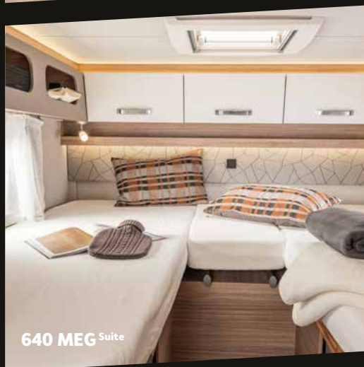
640 MEG Suite