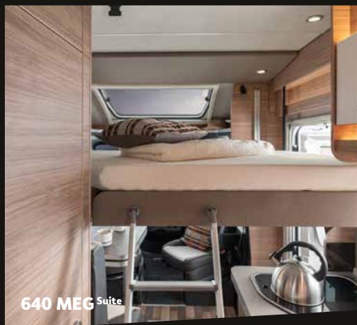
640 MEG Suite