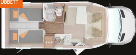
4 Personen Grundriss